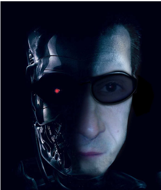
Due volti , un'unica realtà!

Questa volta le carte di Est/Ovest sono semplicemente invertite. Stessi punti, stesse carte, solamente le carte di Est/Ovest hanno cambiato polo! Ora la linea Nord/Sud invece di cadere di 4 o 5 prese con ogni contratto di manche (come nella smazzata precedente) può realizzare tutti i contratti di GRANDE SLAM!!!! I veri buongustai apprezzeranno sicuramente questa bomba ghiacciata! Tutto è relativo, qualche volta bisogna avere un pizzico di fortuna, ciao, alla prossima, Colonel